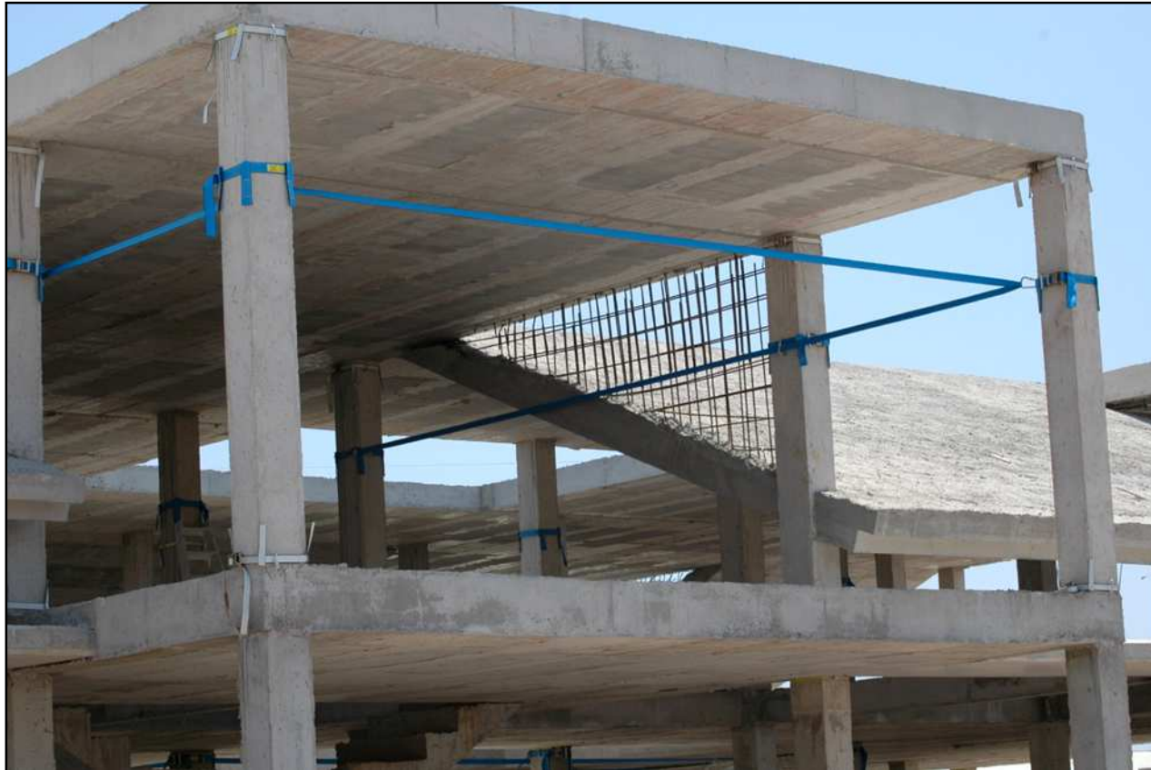
Ref. LUISA, líneas de anclaje fijadas a sistemas de anclaje MultiGarBen CM1