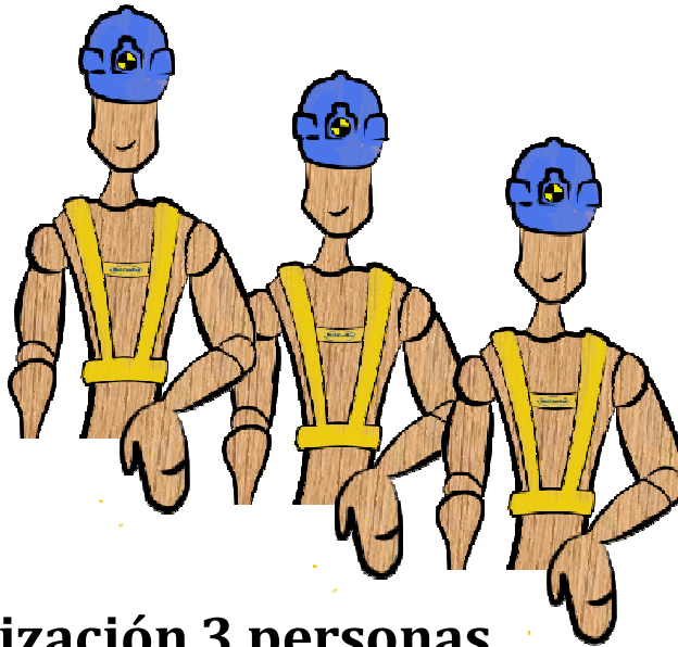
Utilización 3 personas