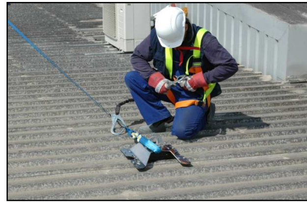
Otras forma de sujetar líneas de anclaje