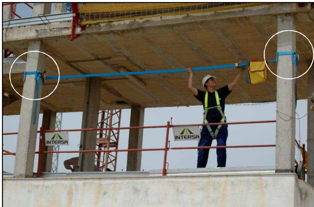
Ref. LUISA, líneas de anclaje fijadas a sistemas de anclaje MultiGarBen CM1